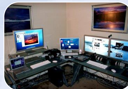
Máquinas y Equipos (Equipos de Telecomunicaciones) M$234.157