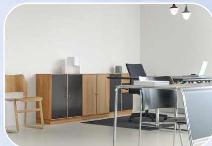
Mobiliario y Otros M$52.126