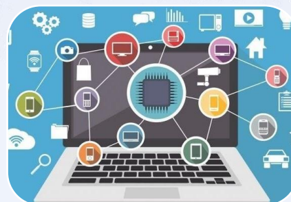
Programas Informáticos (Licencias) M$134.061